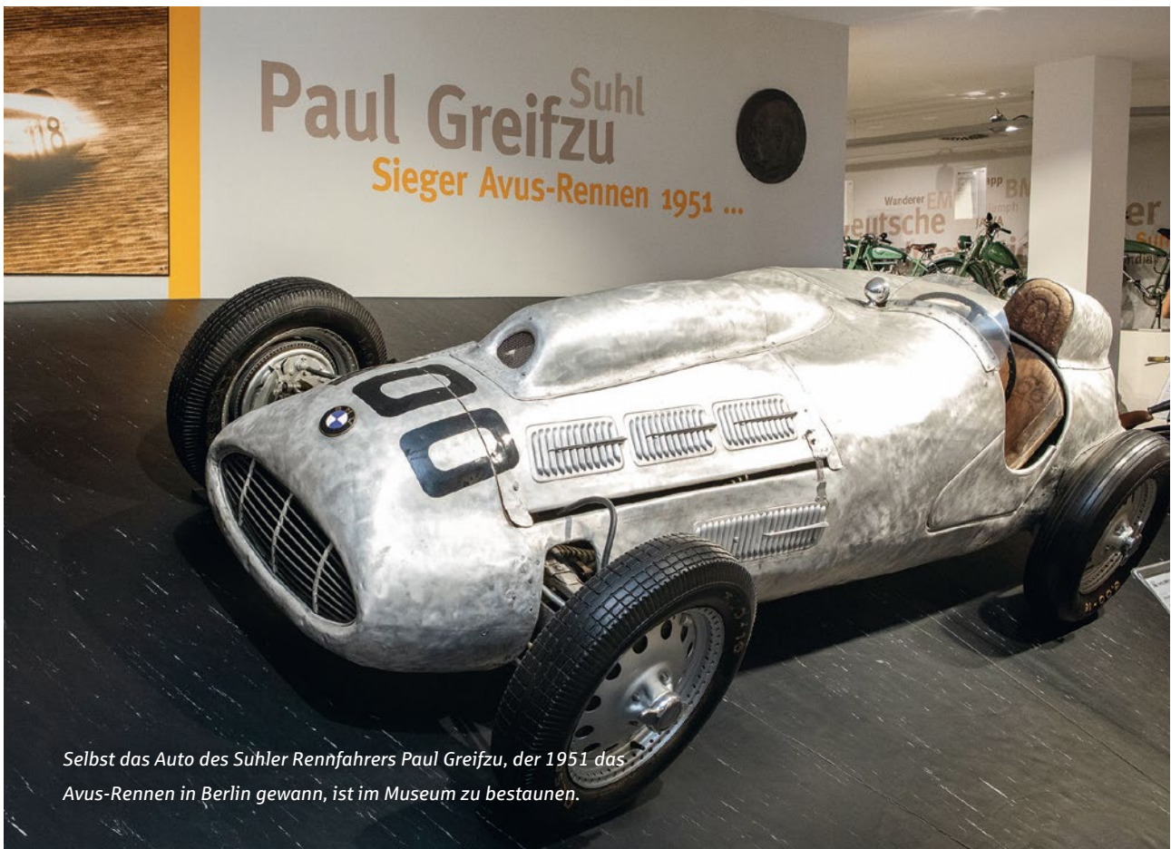
Selbst das Auto des Sühler Rennfahrers Paul Greifzu, der 1951 das Avus-Rennen in Berlin gewann, ist im Museum zu bestaunen.